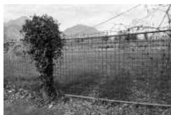
Massetto 1.jpg 5 MB

████████████████████████████████████████████████████████████████████████████████