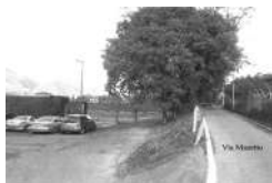
Masetto3.jpg 388 KB