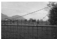
Massetto2.jpg 5 MB